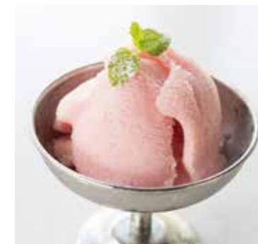
自家製本日ジェラート Today's Housemade Gelato 500