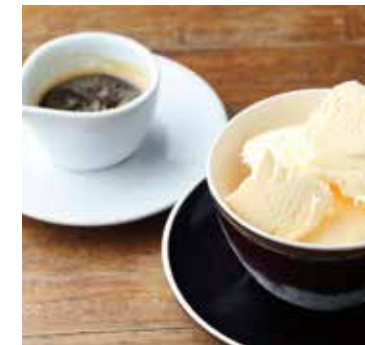
マスカルポーネのセミフレッド アッフォガード仕立て Affogato 600