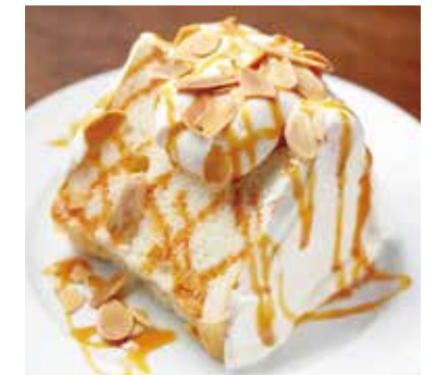
エンゼルフードケーキ Angel Food Cake 600