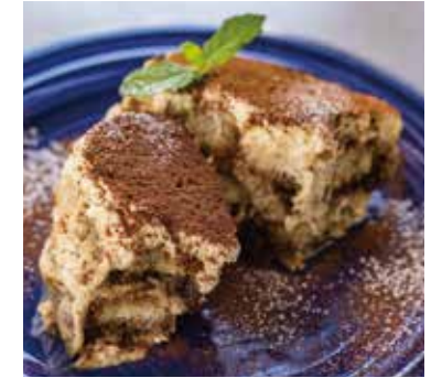
こだわりのマスカルポーネを 使ったティラミス Tiramisu 600