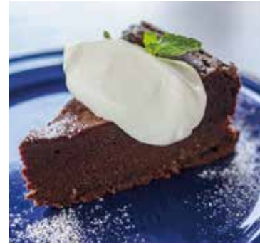
カプリ島伝統のチョコレートケーキ トルタ・カプレーゼ Torta Caprese 550