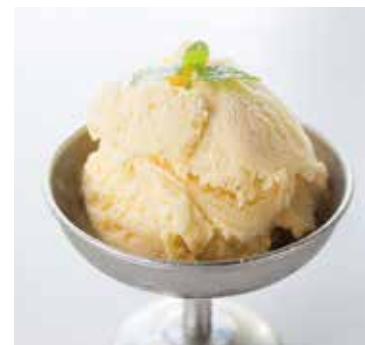
自家製ジェラート "バニラ" Housemade Vanilla Gelato 500