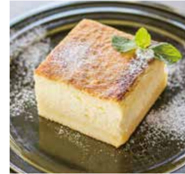
濃厚なチーズケーキ トルタ・フォルマッジョ Torta al Formaggio 500