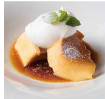
ブディーノ Budino - Italian Pudding 500